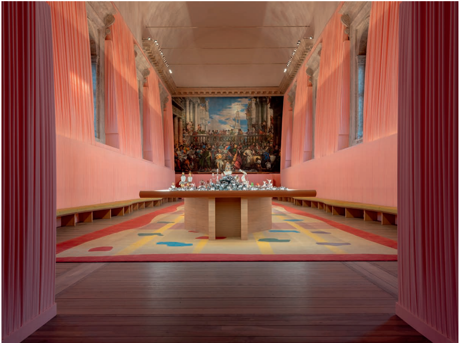
Celebration - Giulio Ghirardi