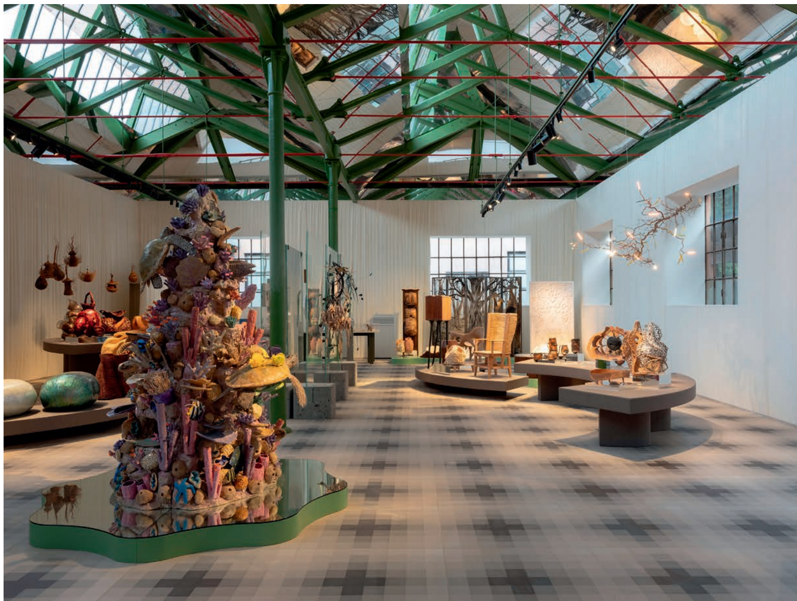
Nature - Giulio Ghirardi - ph. © Michelangelo Foundation

Dieci mostre tematiche che parlano del ruolo dei mestieri d'arte nella vita di tutte le persone: oltre 800 oggetti in mostra, prodotti da 400 artigiani con provenienza variegata, a rappresentare oltre un centinaio di mestieri diversi. Ma non solo: dimostrazioni dal vivo, esperienze artigianali immersive e coinvolgenti ed una diffusione dell'evento stesso oltre i confini dell'isola, offrendo la possibilità di visitare oltre 70 botteghe artigiane che, con Homo Faber in Città, hanno aperto le loro porte al pubblico.