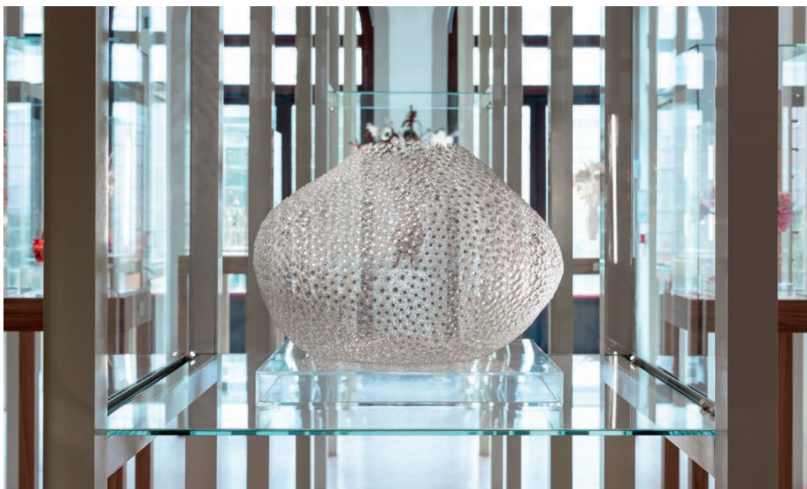
The Wishes - Hyejeong Ko e Alexandre Vazquez